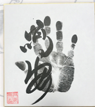
●力士直筆サイン例

開場直後からの力士四名による握手会のあと、力士に直接質問して大相撲の知識を深めていただける質問コーナーや、ご来場の皆様から抽選で20名様に、力士直筆サインや相撲土産が当たる、お楽しみ抽選会も行います。巡業ならではの楽しい企画が盛りだくさんです。